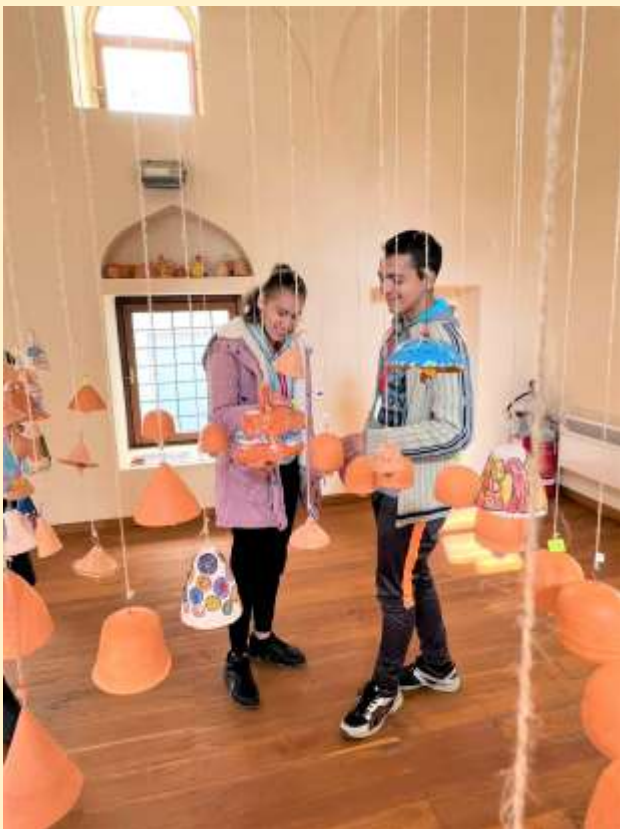
Τα παιδιά μας ανάμεσα στις καμπάνες του κόσμου.

Έτσι ξεκίνησα, με ένα πρότυπο. Όταν ήμουν 15 χρονών στην πόλη υπήρχε μια γκαλερί, η γκαλερί Ρόδι, με κεραμίστρια την κυρία Γαληνού. Με αφορμή μια της έκθεση και αφού είχα έρθει σε επαφή με τον πηλό, αποφάσισα ότι θα κάνω το βήμα. Έβλεπα το αποτέλεσμα. Εκτός από τα κανάτια που είδα στους Μικρασιάτες παππούδες μας, είδα και πώς ήταν η σύγχρονη κεραμική. Είναι πολύ ωραία να βρίσκεις ανθρώπους που να μπορείς να επικοινωνείς όμορφα. Υπήρχαν όμως και πολλοί από τα βιβλία που διάβαζα. Η Μαρία Κιουρί πάντα μου άρεζε. Αυτή η γυναίκα